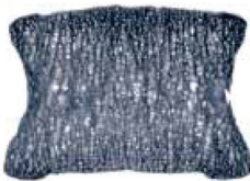
کاهش توده استخوانی